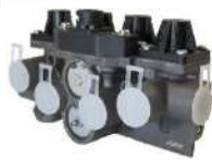
マルチプロテクション バルブ