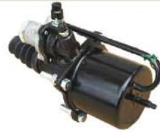
クラッチブースター