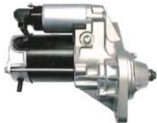
スターターモーター