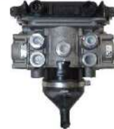
EBS アクスルモジュレーター