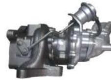
ターボチャージャー