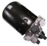
エアードライヤー