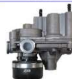
プロポーショナル リレーバルブ