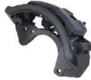
ブレーキキャリパー