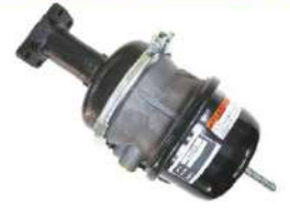
ブレーキチャンバー