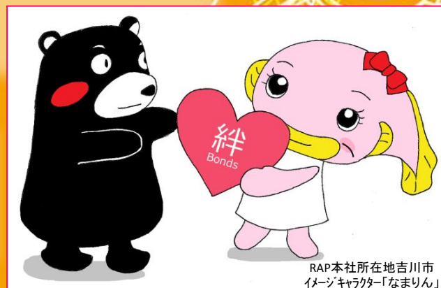
RAP本社所在地吉川市 イメージキャラクター「なまりん」

ア-ネストでは全社員に寄付金を募りました。少しでも力になりたいという思いから活動し、被災者の方が笑顔になれたらと思っております!